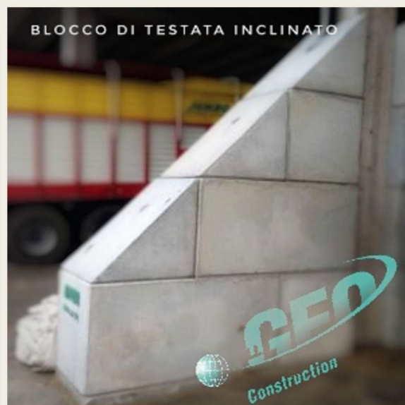
BLOCCO DI TESTATA INCLINATO