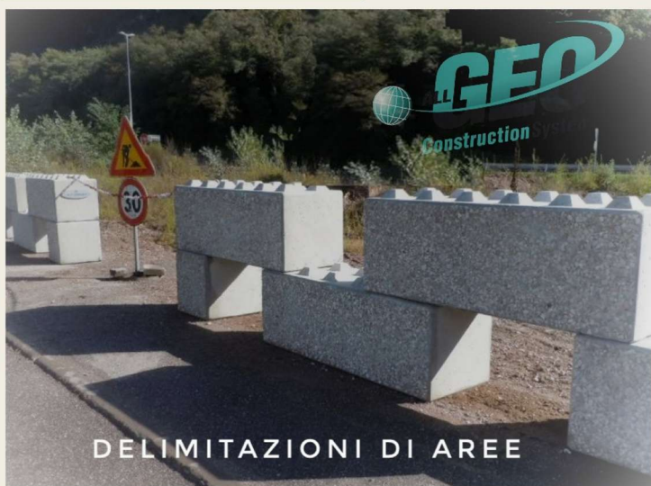
DELIMITAZIONI DI AREE